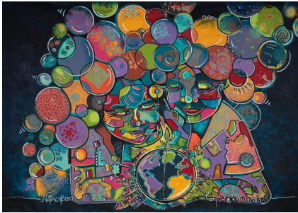
© Eric Moroni Création originale de Natimo et des Copains du Monde du Secours Populaire de l'Ardèche